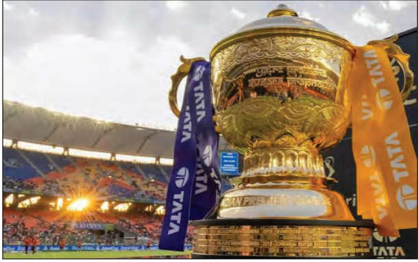
रिपोर्ट की खास बातें

बीसीसीआई को एशिया कप के कारण इंटरनेशनल टूर के मद में 109.44 करोड़ का फायदा होगा। इनमें एशिया कप की होस्ट फीस के अलावा, टी-20 वर्ल्ड कप की पार्टिसिपेशन फीस से इंटरनेशनल